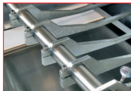
TAGLIO A FILO WIRECUT COUPE A FILE

La nostra politica è di continuo miglioramento e sviluppo. Ci riserviamo quindi il diritto di modificare le informazioni contenute in questo depliant senza nessun preavviso. Our policy is aimed to a constant improvement and development. We therefore reserve the right to amend the information given in this leaflet without prior notice.