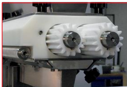
TESTA A POMPA PUMP HEAD TETE A POMPE